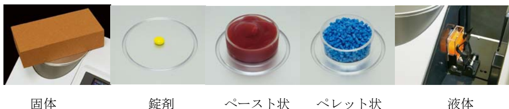
(図4) サンプル測定例

本機では反射と透過の両方の測定が可能である。さらに、豊富なアタッチメントと工夫された構造により、1台で幅広い用途の測定を可能とする。別売のシャーレやセルを使えば粉体や液体なども容易に測定でき、固体、液体、練り物、粉体、錠剤、あらゆる形状のものの色管理が可能となる。(図4)