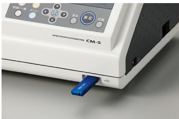
(図3) USB メモリ挿入図

いろいろなサンプル測定で条件設定を変更する場合や複数のユーザーが使用する際には、条件設定の変更が煩わしく、間違いも生じやすい。USB メモリでの条件設定は、予め USB メモリにユーザーの測定条件を登録しておき、それを差し込み選択することで設定の読み込みが行えるため、素早く簡単に間違いのない条件設定を可能となる。(図3)