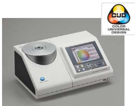
（図1）CM-5 / CR-5 外観図

豊富なアタッチメントにより、反射、透過、シャーレ、液体夫々の測定モードへの切り替えが可能で、一台で固体、液体、練り物、粉体、錠剤の測定を可能としている。