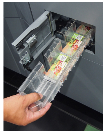
名刺も1枚1枚断裁されて出力

刷り上がりの結果をお尋ねすると、「テカリが抑えられていて、細かい調整も効きます。これまでのデジタル印刷機の認識は大きく変わりました」。お客様の評判も上々で、品質にも満足してい