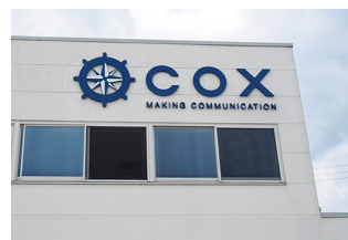
株式会社コックス様

長野県佐久市で、印刷、サイン、デザインをはじめ、幅広くビジネスを展開する株式会社コックス様。印刷ビジネスの主力であるオフセット印刷の需要が年々減少傾向にありました。この問題に 대응するために導入されたのが、コニカミノルタのオンデマンド機 AccurioPress C4080 (RISAPRESS Color 4080) と、多彩な加工を実現するトリマーユニット TU-510 でした。これにより、小ロットでお客様のニーズにきめ細かく応える印刷加工が可能になるとともに、オフセット印刷との役割分担が実現。さらに外注費の削減や時短、印刷の効率化にも大きく貢献することができました。